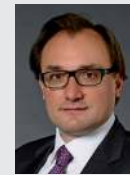
Laszlo Nagy NZP Nagy Rechtsanwälte